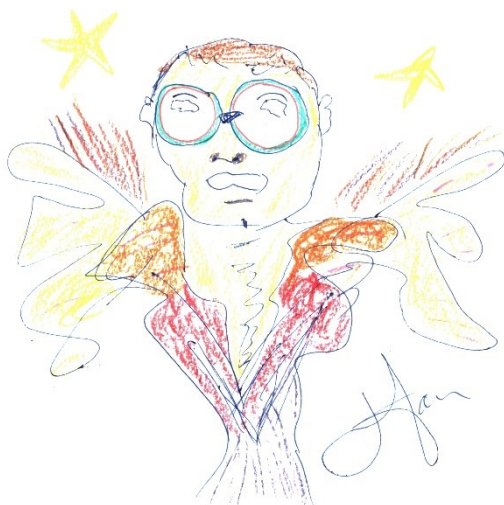
3_Elton John Selbstporträt, o.J., Privatsammlung