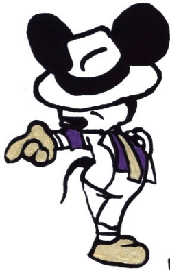
1_Michael Jackson Me as Mickey Mouse, o. J., Privatsammlung