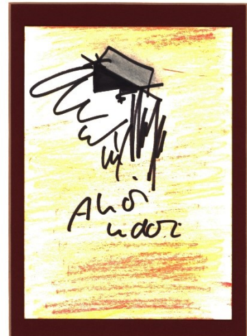
2_Udo Lindenberg Ahoi, o. J., Privatsammlung