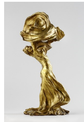
7. François-Raoul Larche, Tischlampe »Tänzerin Loïe Fuller«, um 1900

Museum für Angewandte Kunst Köln (MAKK), Dauerleihgabe der Otto Wolff Stiftung, Köln