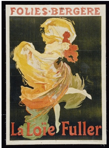
4. Jules Chéret, Folies Bergère. La Loïe Fuller, 1893

Le Signe – centre national du graphisme, Chaumont