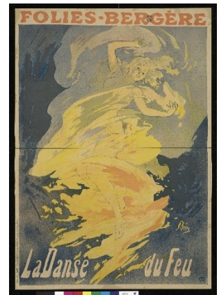
5. Jules Chéret, Folies, Bergère. La Danse du Feu, 1897