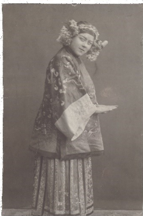
3. Anonym, Loïe Fuller auf Tournee mit Sada Yacco, o. J.