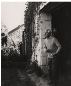
3_Helmut Hahn, Max Ernst beim Boulespiel III, Huismes, September 1957, Silbergelatineabzug, Max Ernst Museum Brühl des LVR