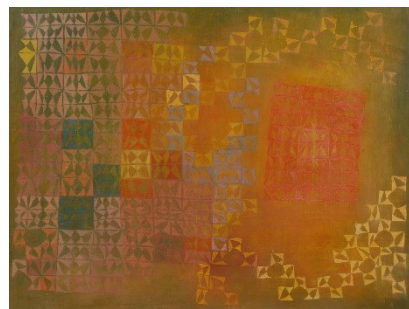
5_Helmut Hahn, o. T., 1958, Eitempera auf Leinwand, Kreismuseum Zons, Foto: Martin Langenberg