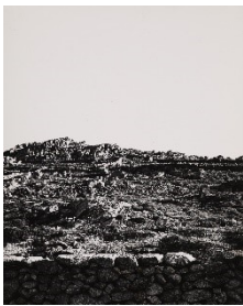
1_Helmut Hahn, Mykonos, 1958, Silbergelatineabzug, © Fotografischer Nachlass Helmut Hahn, Museum Folkwang, Essen