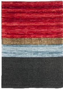
8_ Helmut Hahn, In der Nacht, die Schatten der Sonne, 1991, Futterseide, Duchesse, Seide, Baumwollgarn, Rippenstramin, Vlies, Kreismuseum Zons