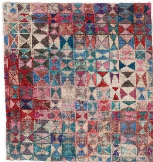
6_Elisabeth Kadow, Petit-Point (Rot-Blau), 1948, Gewebe und Stickerei auf Leinen, Museum Abteiberg Mönchengladbach