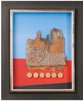
4_Helmut Hahn, Rendre hommage à M. E., 1972, Assemblage, Objektkasten, Kreismuseum Zons