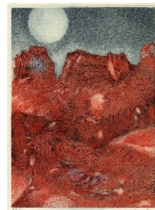
2_Max Ernst, Vue de ma fenêtre, 1960, Kupferstich, farbige Aquatinta, Clemens Sels Museum Neuss, © VG Bild-Kunst Bonn, 2021