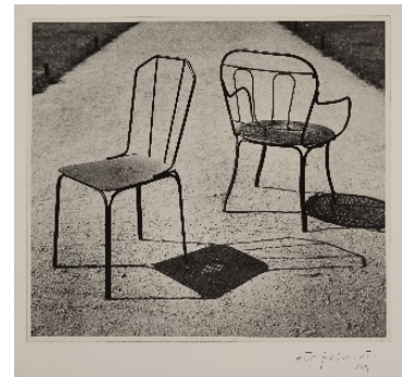
9_ Otto Steinert, Renvoyés Dos à Dos, Paris, 1948/49, Silbergelatineabzug, © Nachlass Otto Steinert, Museum Folkwang, Essen