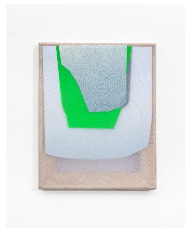
2_Artjom Chepovetsky, 08 (05), 2021, Mixed Media auf Chiffon, 25 x 20 cm, im Besitz des Künstlers