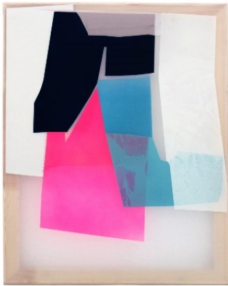
3_Artjom Chepovetsky, 2 (12), 2021, Mixed Media auf Chiffon, 50 x 40 cm, im Besitz des Künstlers