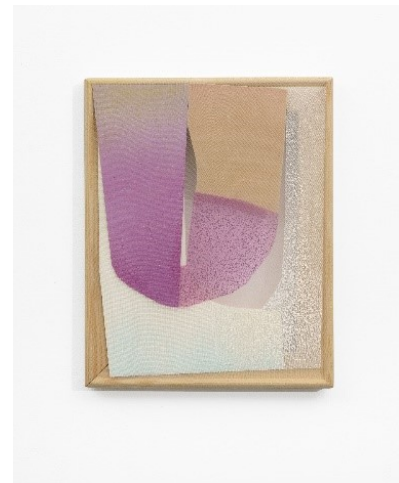
4_Artjom Chepovetsky, 2 (4), 2022, Mixed Media auf Organza, 25 x 20 cm, im Besitz des Künstlers