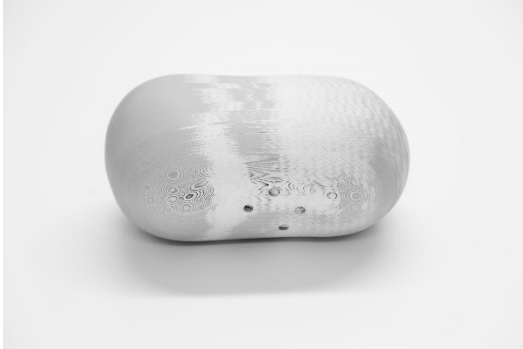
6_Goekhan Erdogan, ohne Titel, 2022,

Drucke, Leim, 12,8 x 25,2 x 14,5 cm, im Besitz des Künstlers