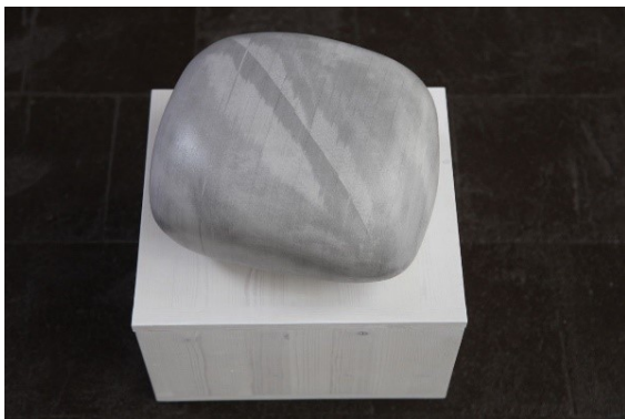
8_Goekhan Erdogan, ohne Titel, 2019, Drucke, Kleber, 16,5 x 30,5 x 26, 5 cm, im Besitz des Künstlers