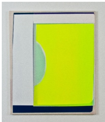
1_ArtjomChepovetsky, (7), 2019, Mixed Media auf Chiffon, 60 x 50 cm, Privatbesitz